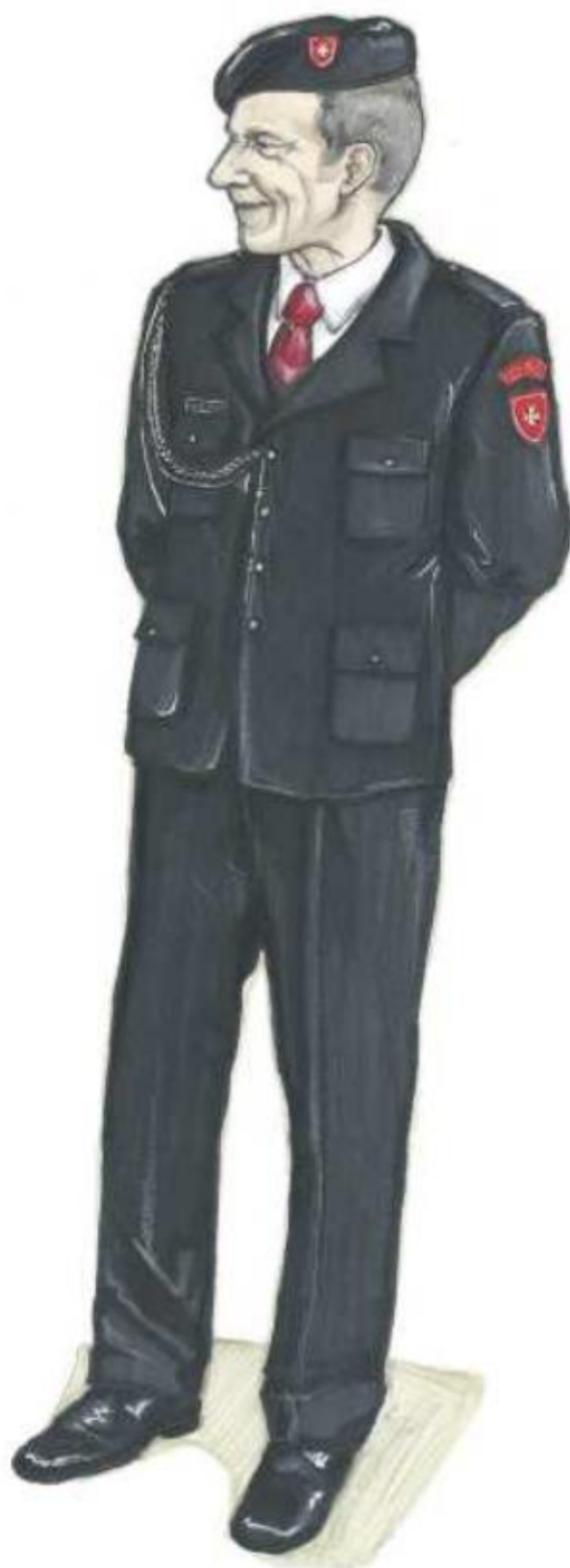
Ryc.1. Mundur galowy męski.