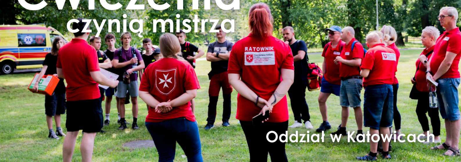
Oddział w Katowicach

III Plenerowie Spotkanie z Pierwszą Pomocą. W sobotę, 8 czerwca już po raz trzeci w Katowicach odbyło się Plenerowe Spotkanie z Pierwszą Pomocą.